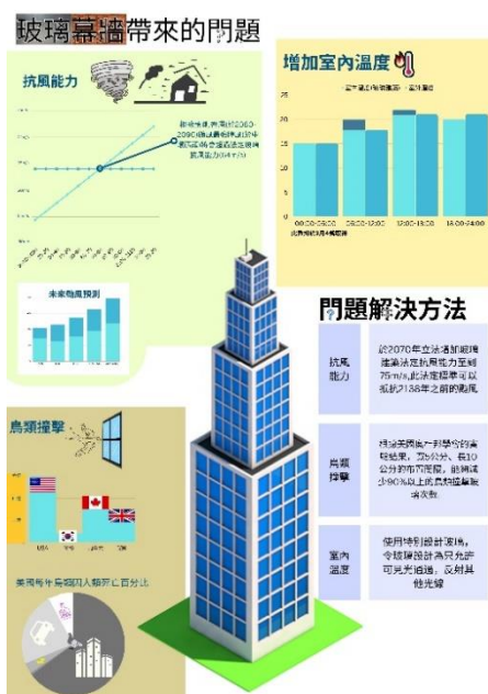
3C 許詠誠 優異獎